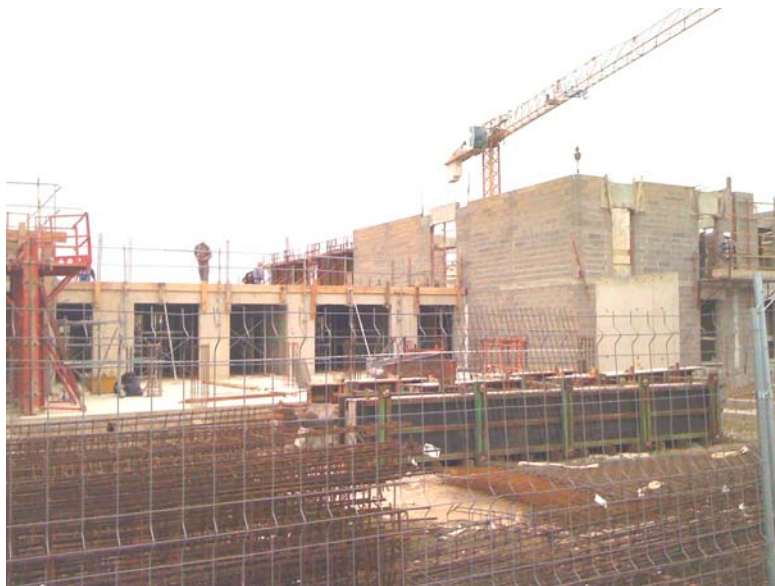
Ci-dessus : Construction de la Maison de Retraite

Les riverains concernés par ces travaux recevront une invitation à participer à une réunion d'information.