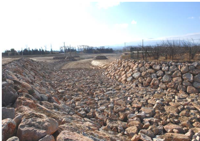
Ci-dessus : Travaux de la déviation de la berne