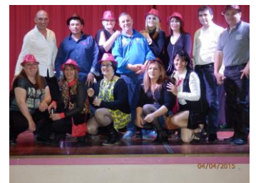
DISCO CLUB PEZILLA " LE STAFF" Soirée du 4 avril 2015