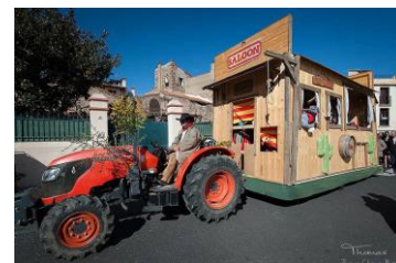
Carnaval - 15 mars 2015