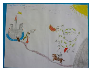
Dessin gagnant Sant Jordi 2014